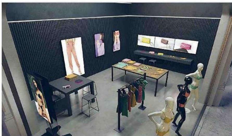
ANALIZZARE L'ESPERIENZA DI ACQUISTO IN UN'AZIENDA ESPORANDO LE MIGLIORI SOLUZIONI TECNOLOGICHE