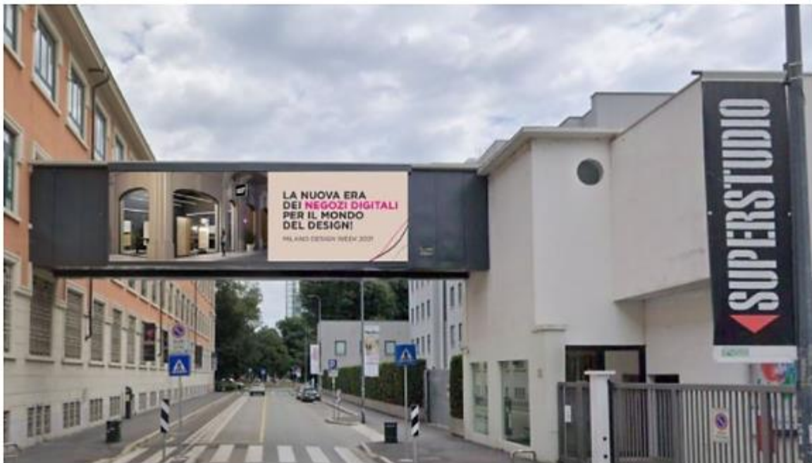
Una delle installazioni realizzate da Pladway per Voilàp Digital

La campagna MOOHbile Drive-to-Digital ha intercettato con successo il target Business nei Districts dei Salone del Mobile a Milano