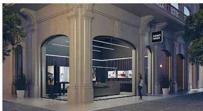
WWW.VOILAPDIGITAL.COM PER MAGGIORI INFORMAZIONI