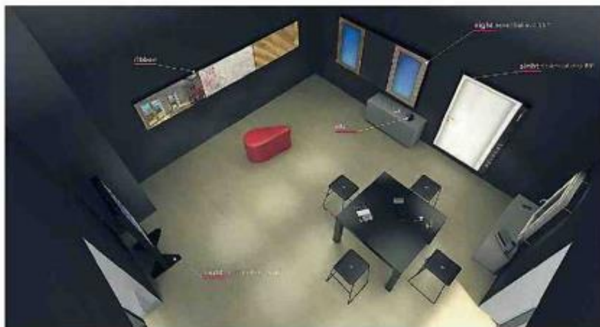
SUITE INTEGRATA HARDWARE, SOFTWARE, CONTENUTO E ANALITICHE